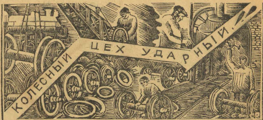
Рабочие колесного цеха ВРЗ первые показали пример заводу, они объявили свой цех целиком ударным. Рабочие других цехов равняются по рабочим колесного цеха.