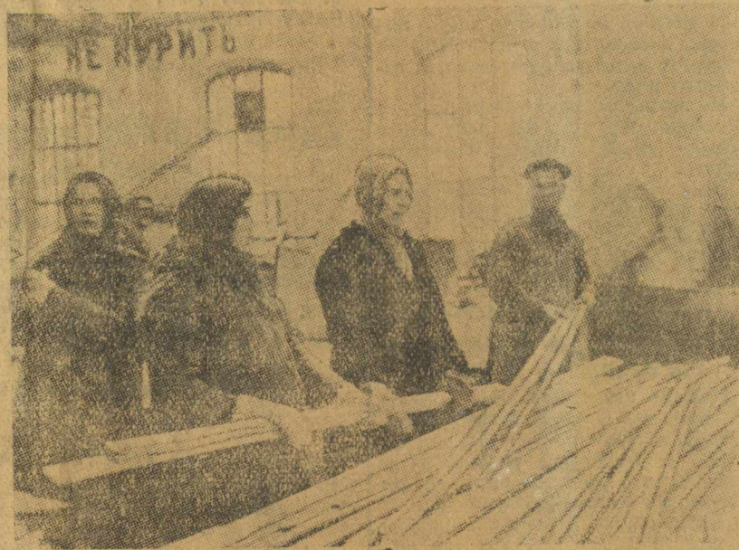
Жены рабочих ВРЗ, вышедшие вместе с мужьями на работу во второй день индустриализации, 25 декабря, показали ударные темпы в работе. Расквашивая по всем цехам, они производили вспомогательную работу. На снимке в столярном цехе жены рабочих сортируют пиломатериалы