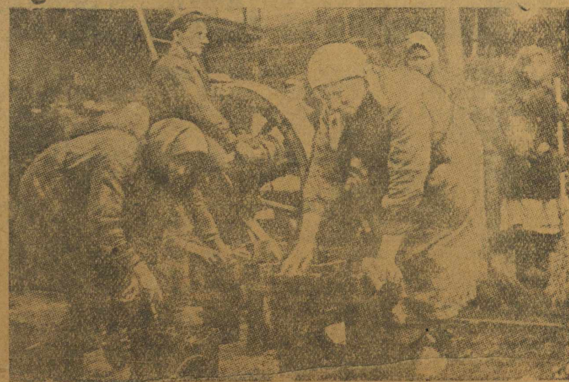
25 декабря в ВРЗ было днем ударной работы, показавшей образцы трудового героизма. Не было ни одного прогула, вместе с рабочими вышли их жены. На снимке: рабочие ВРЗ с семьями производят очистку паровозных букс