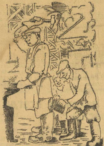
Фабзаучники «за работой»

ством, мешая работать взрослым рабочим. Например, не так давно у одного из учеников хулиганы спря-